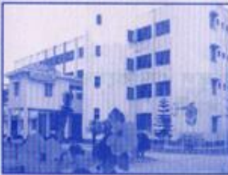
ইংলিশ ভার্শন ভবন